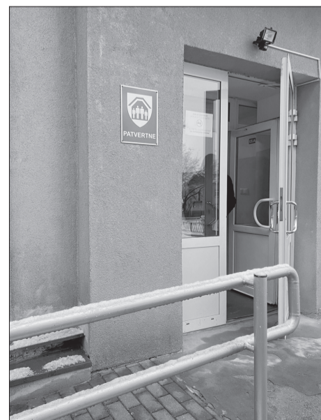
Norāde par bumbu patvertni pie Preiļi 2. vidusskolas

Jāpiebilst, ka Rīcības plānā Austrumu pierobežas drošībai un izaugsmei papildus ir iecerēts ierīkot ap 200 patvertnes esošo ēku pagrabus un pazemes stāvos atbilstoši vadlīniju vai normatīvo aktu prasībām. Kad un kā tas notiks, pagaidām skaidrības nav.