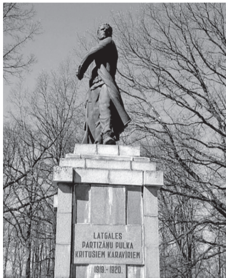
Piemineklis Latgales partizānu pulka kritušo karavīru piemiņai izveidots 1938. gadā, 1993. gadā atjaunots, godinot arī 1944.–1954. gada Latgales nacionālos brīvības cīnītājus

* Balvu novads – nozīmīgs Ziemeļlatgales centrs, kas reformas rezultātā izveidojās 2021. gadā. Novadā ietilpst 19 pagasti, Balvu un Viļakas pilsēta.