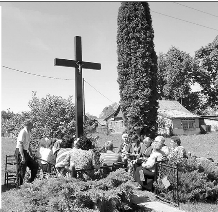
Maija dievkalpojums pie Sarkanu ceļmalas krusta Vaboles pagastā (2017. gads)