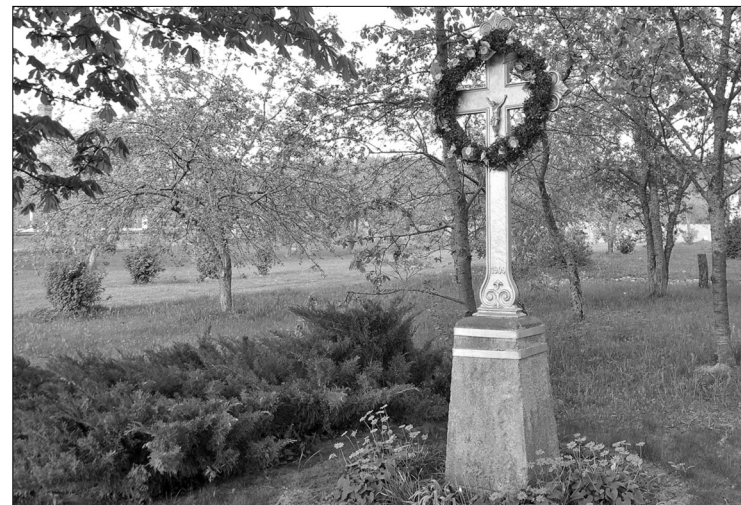
Teniss dzimtas krucifikss – bērnu veltījums mammai