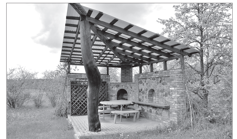
Akmens lapene ar akmens kamīnu

Fakti apkopoti no wikipedia.org