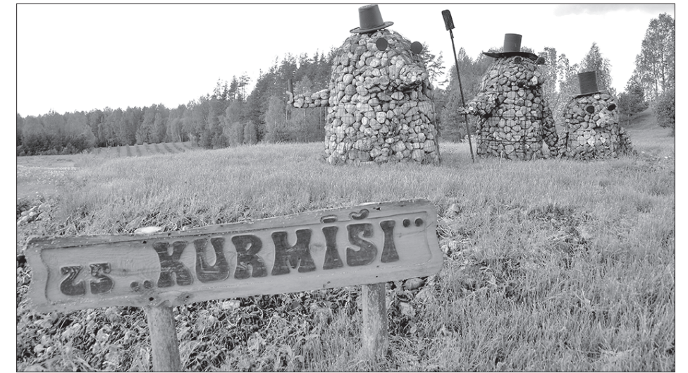
Trīs kurmji ir ZS «Kurmīši» vides vizītkarte

Viens fakts par akmeņiem. Akmeņi ir dzīvi un izstaro enerģiju.