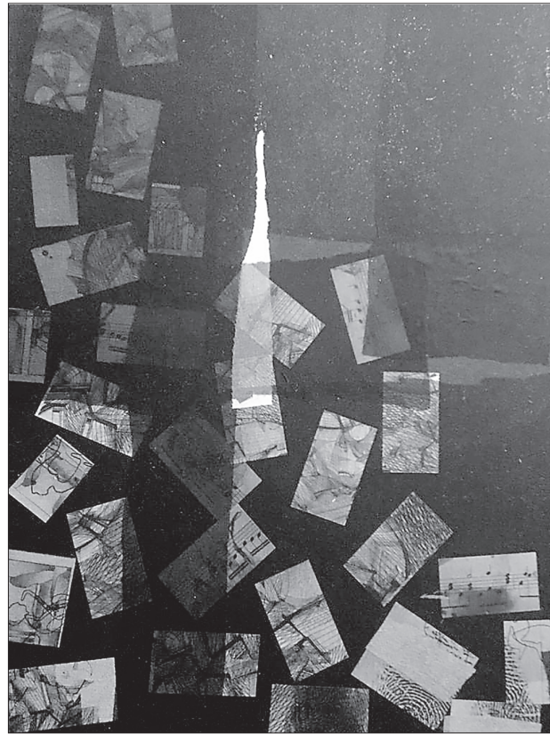
Tekstildarba «Melnais caurums» fragments