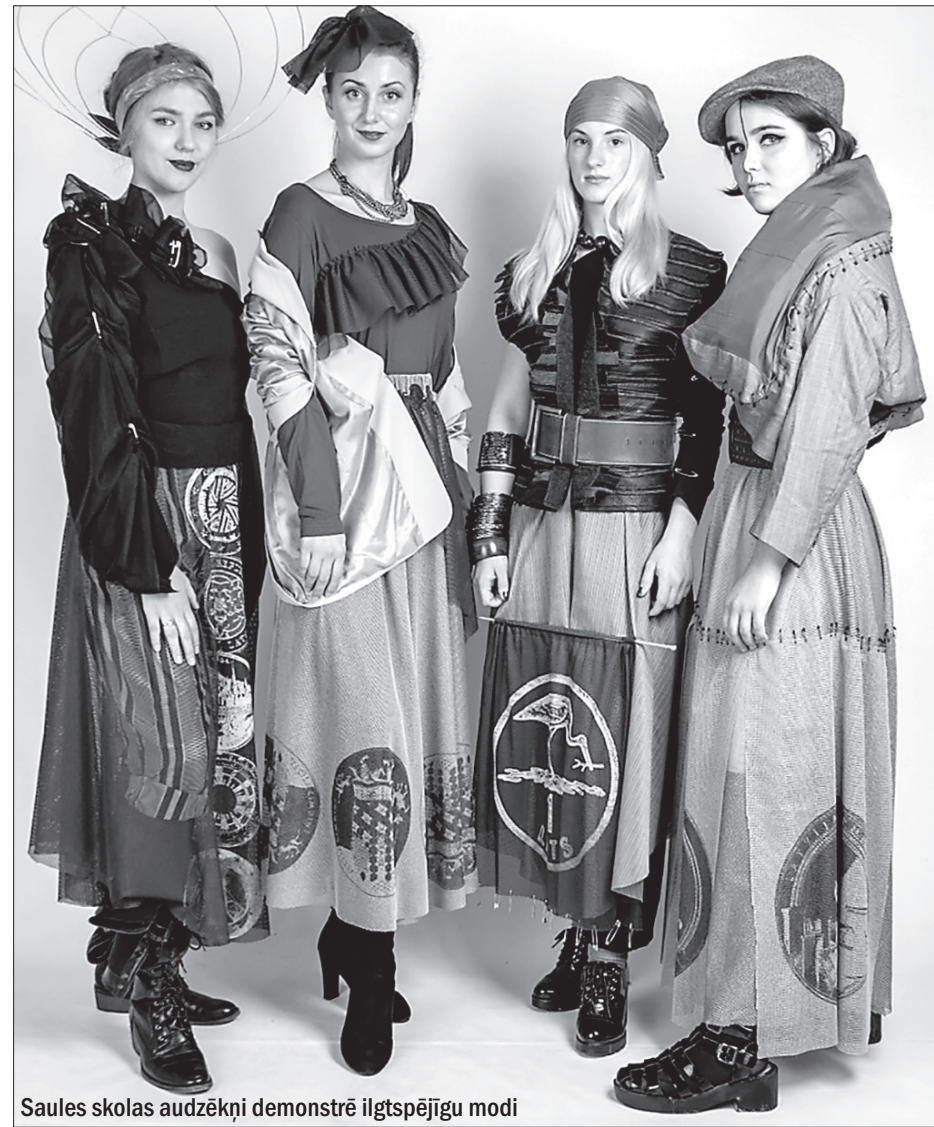
Saules skolas audzēkņi demonstrē ilgtspējīgu modi

Interesanti, ka Saules skolai ar Lietuvas un Itālijas sadarbības partneriem ir jauna ideja veidot mājaslapu, kur varētu reģistrēties tie uzņēmumi, kas atbalsta Eiropas Savienības zaļo kursu, ražo ilgtspējīgus produktus, modi, dizaina un interjera priekšmetus u.c. Turpat būtu apmācību piedāvājums tiem, kuri grib padziļināt zināšanas savā jomā, un tiem, kuri vēlas uzsākt savu eko biznesu. Tāpat mājaslapa apkopotu uzdevumus un metodiskus materiālus skolām, lai skolotāji popularizētu zaļo domāšanu arī stundās.