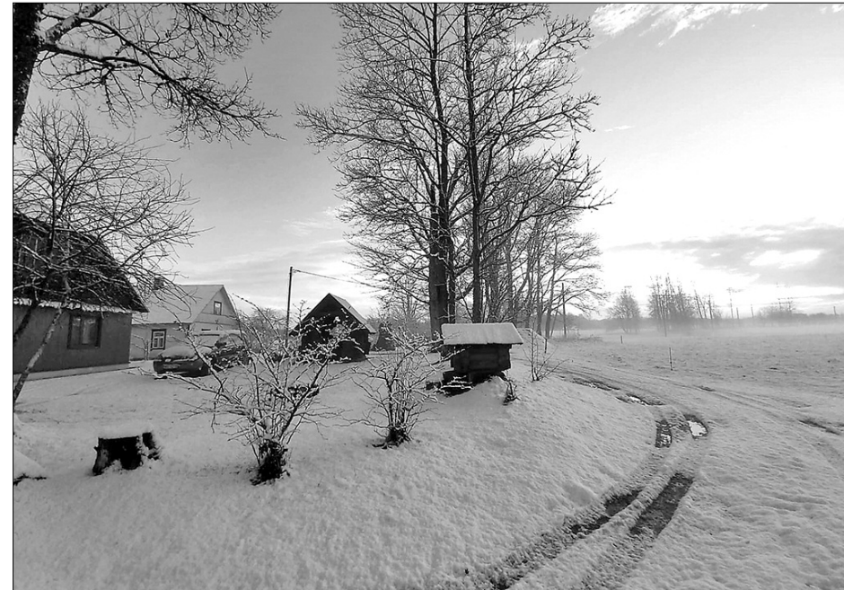
Zīmys reits Ignalinā

Īspejju ir daudz. Tīk, kai jau sacieju, juosaprūt, ka, dzejīvojūt dzerānē, navajag obligātī gūvei byut, zemi struoduoit, vari ite dzejīvuot i ofīsā struoduoit voi nu sātys koč kū dareit, tū pošu amatnīceibu. Īspejju ir daudz.»