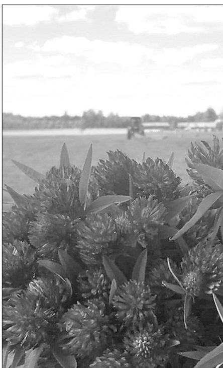
Vysa lobu juoņū zuole...