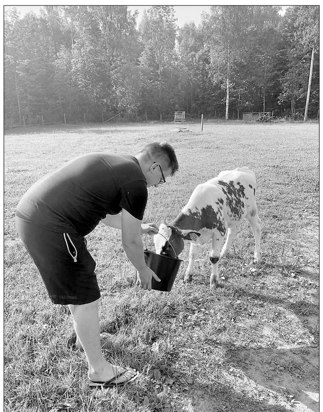
Kuozu ūtruo dīna – izsluopūši na tikai gosti, bet ari teleņi jopadzryda