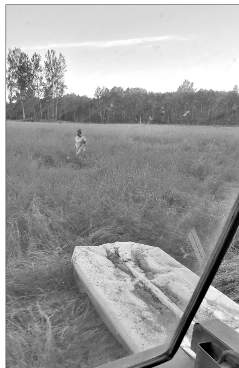
Sabīne bīzajā zuolē pyrms pļaušonys meklej, voi kur nagūj kaidis stymalāns

Voi ir reāli suokt saimnīkuot nu nullis? «Nasēņ laseju rokstu, ka jā, var – suokt ar mo-zumeņu, īkruot naudu, nūpīerkt zemīs plekeiti, tomātus audzēt... Bet navar, reāli tod vajag koč kū blokus dareit. Ka nav montuojumā zemīs, it kai var puors gektaru nūpīerkt, bet vajag atrast, kur nūpīerkt. Audzēt i dareit var, bet, lai izdzejīvuotu, normāli dzejīvuotu, ka suokt nu nullis, ir baigi gryutai. Tī tod juobyut lobam kapitālam, kai ir tī veiksmīs stuosti, ka atsagrīz nu uorzemem, pīpeļnjejuši naudu, i uzsuok kū tukšā vītā. Ka kabatā viņ puors tyukstuši, principā tys ir nareali. Ari visi tī atbolsti tīk pīšķierti tikai tod, ka pyrms tam esi koč kū dariejis. Navar tai, ka nīkuo nav, uzroksti projektu i suoc saimnīkuot.»